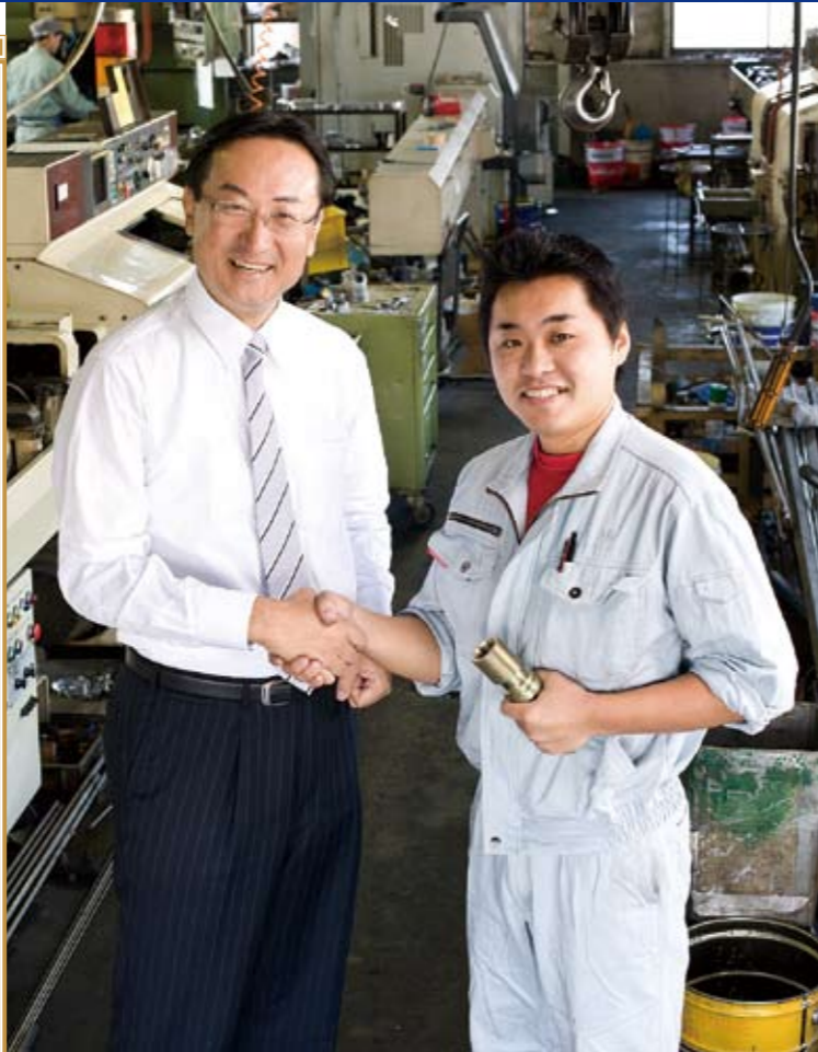
鉄工所を視察し、激励する岡田直樹 =平成 21 年 10 月 金沢市内