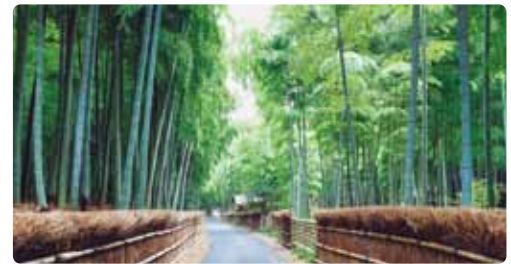
地方には、観光立国への魅力があふれている。