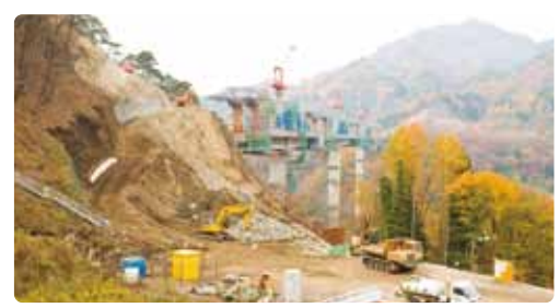
「コンクリートから人へ」では暮らしは守れない。写真は、突然事業が中断されたハツ場ダム。