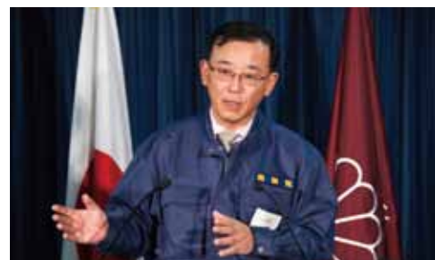
自由民主党総裁 谷垣禎一

自民党は全力で戦います。被災地のみなさんに、そして全国の地方・地域に光がさすように。皆さんと一緒に前を向いて、地方から大切な日本を立て直すために。そして、再建をなしえた日本が新しい希望の明日を迎えるために。